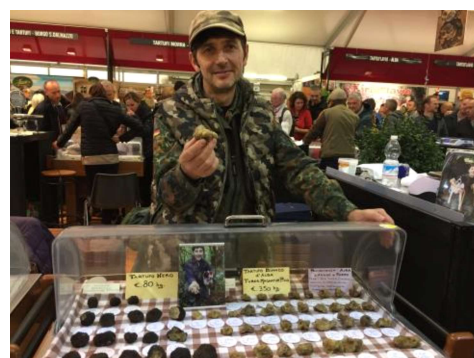
Trüffel-Markt in Alba